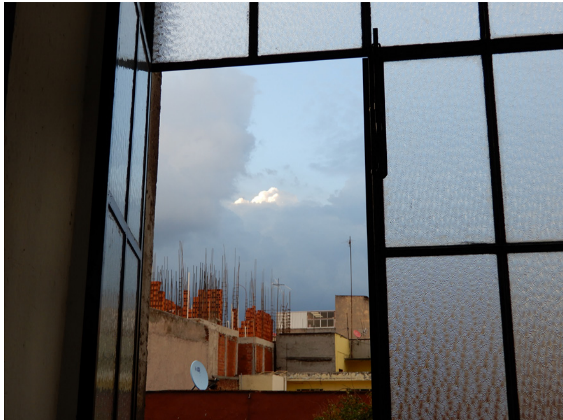
Estación de lluvias | Agosto 2018