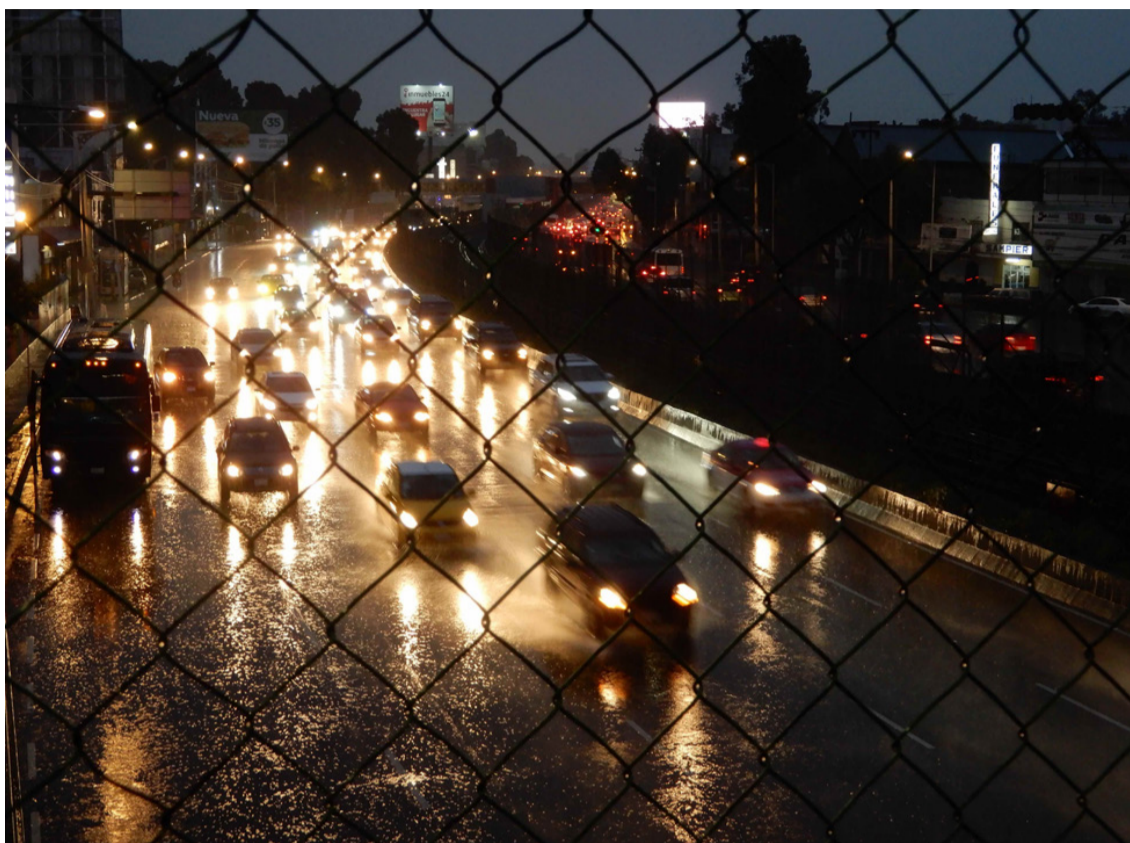
Tlalpan | Octubre 2018

En algún momento la Oficina Internacional quiso que tomara una decisión, así que dejé el curso de tatuaje y sólo tuve un curso en los últimos dos meses. Esto siempre ocurría el miércoles durante tres horas. Aquí había un texto para leer cada semana, sobre el cual deberíamos escribir reportes. Además, cada uno de nosotros dio una presentación sobre artistas queer contemporáneos o históricamente significativos.