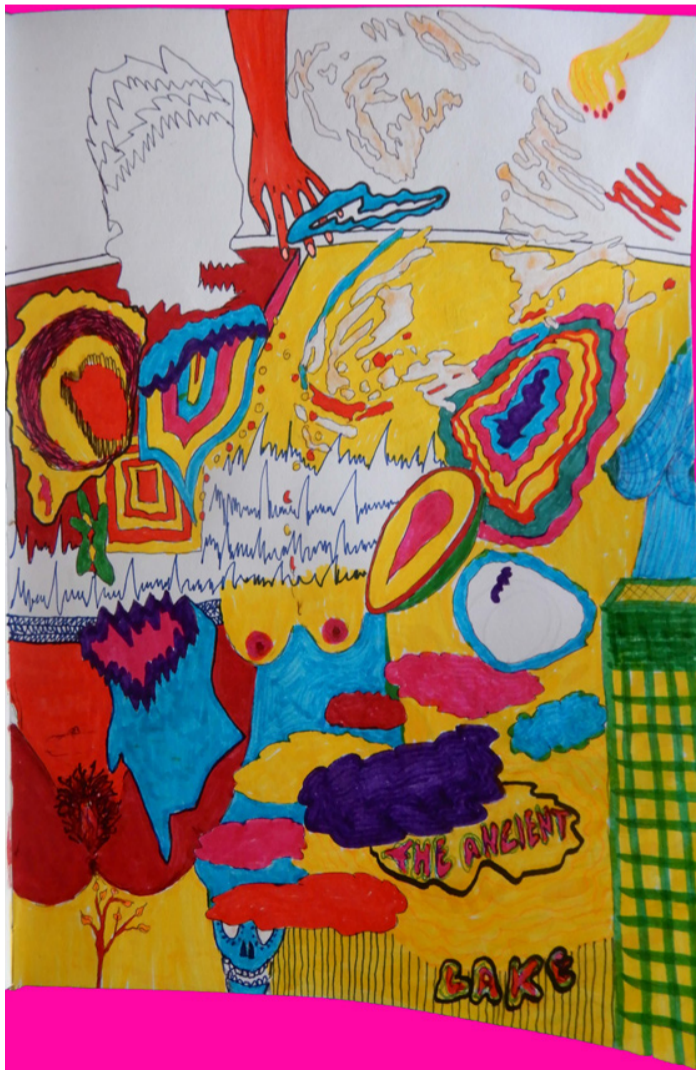
The ancient lake | Noviembre 2018