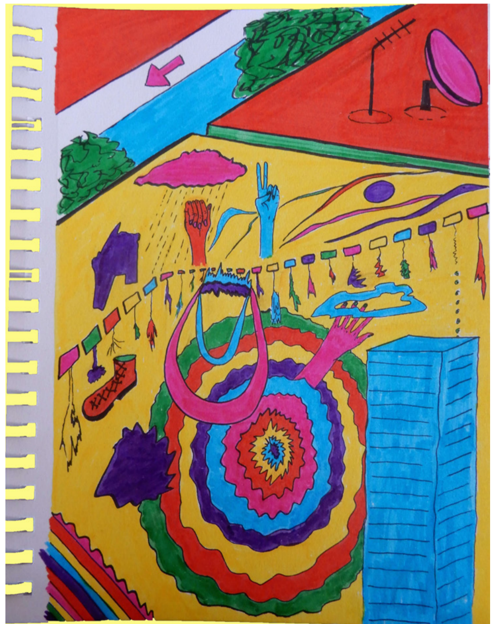
Ciudad loca | Noviembre 2018