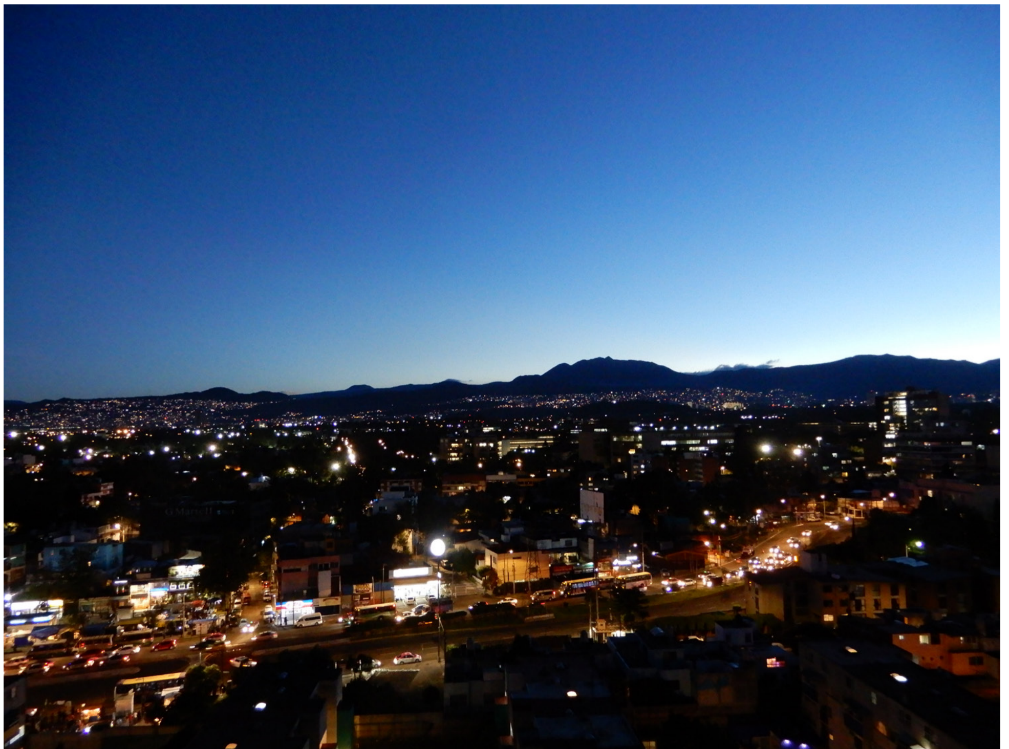
Las estrellas de la ciudad | Noviembre 2018

Disfruté mucho dejando el contexto europeo y mirándolo desde fuera y notando las diferencias e igualdades que existen entre Europa y América Latina.