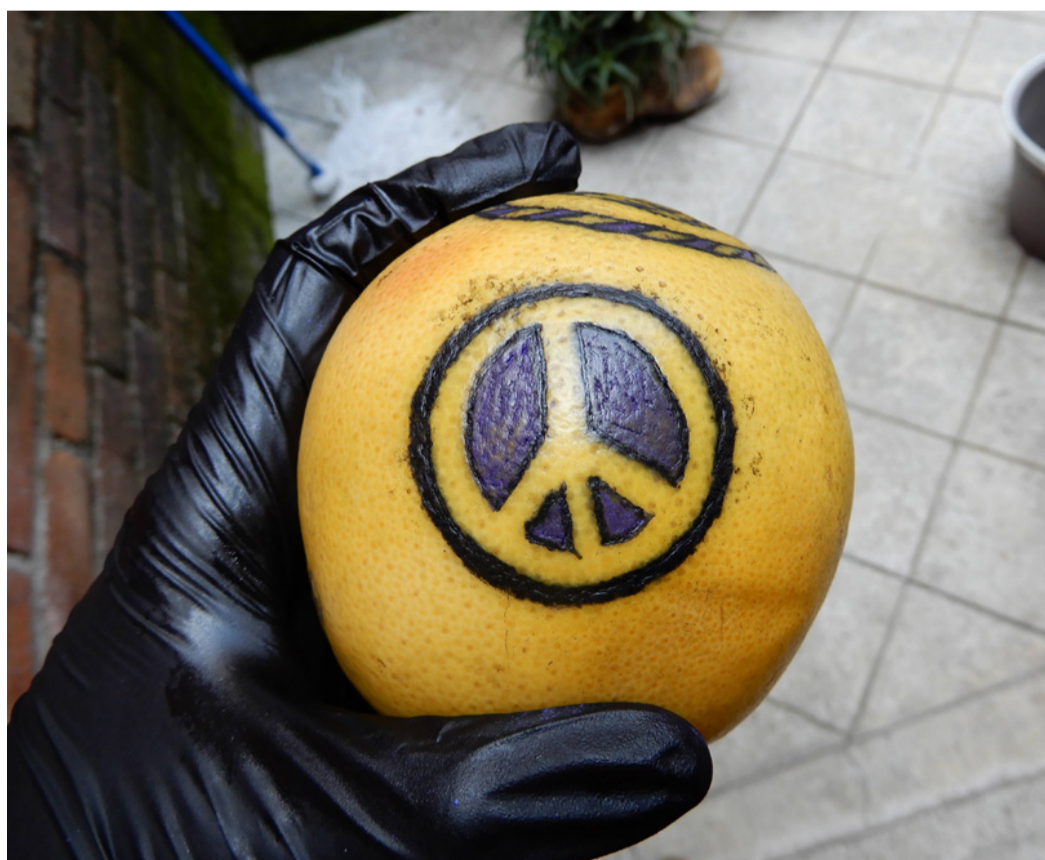
Paz en naranja | Agosto 2018