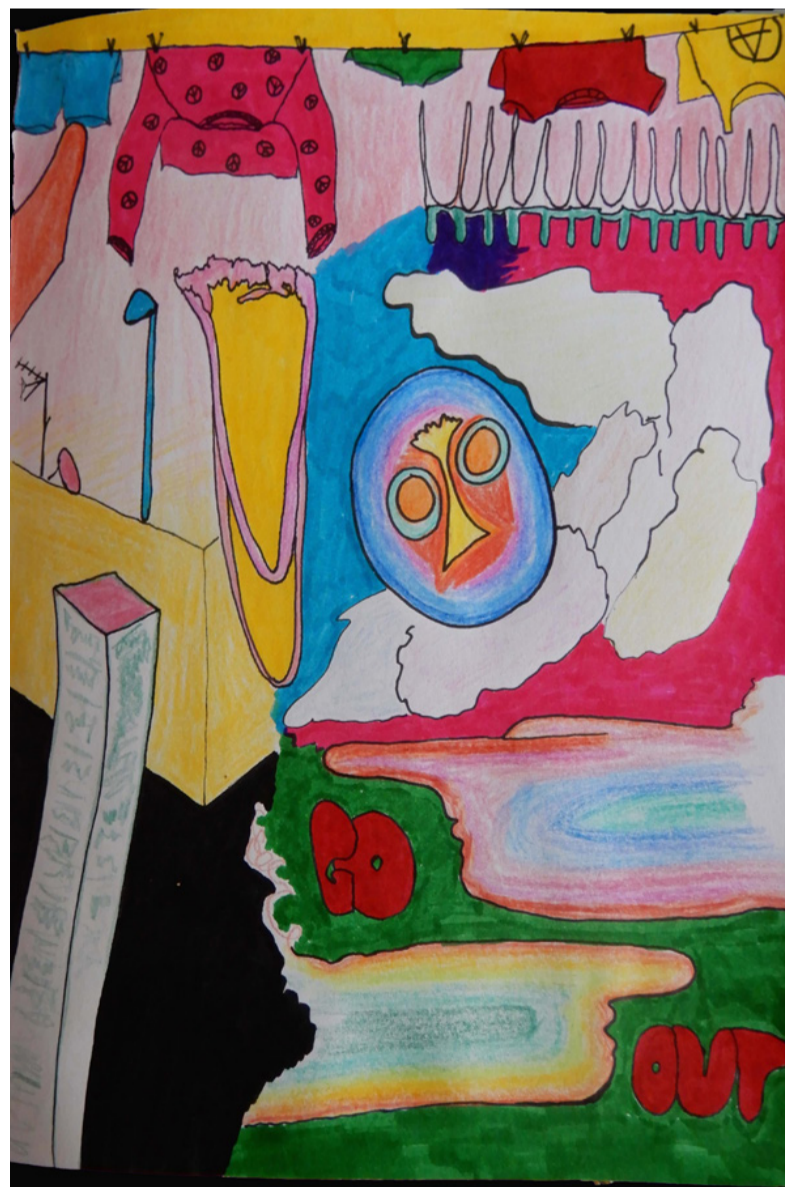
Vamos | Agosto 2018