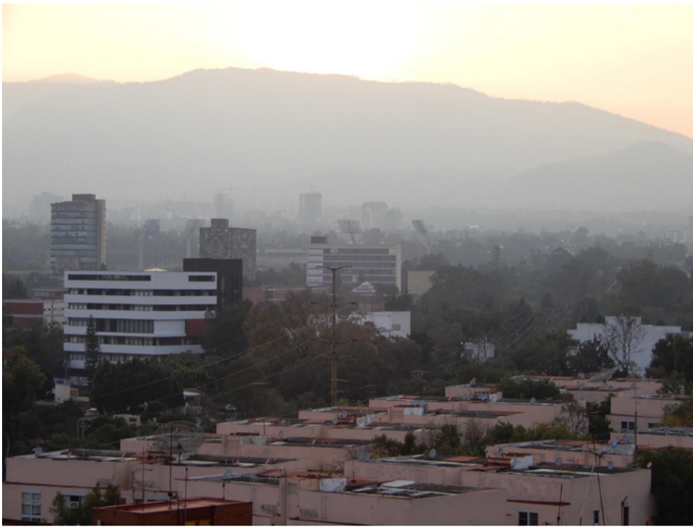
La ciudad se sumerge en la niebla tóxica | Noviembre 2018

Por ejemplo, fui con dos amigas a Tlazala de Fabela, un pequeño pueblo en las montañas. Allí visitamos con otros conocidos un lugar otomí, que fue muy impresionante. Contemplé tanto el paseo través de las como esta enorme plaza ritual montañas boscosas construida en la década 1 de 950. Después de este corto viaje a las montañas me sentí muy relajado y pude empezar de nuevo con más energía en la vida cotidiana de la ciudad loca.