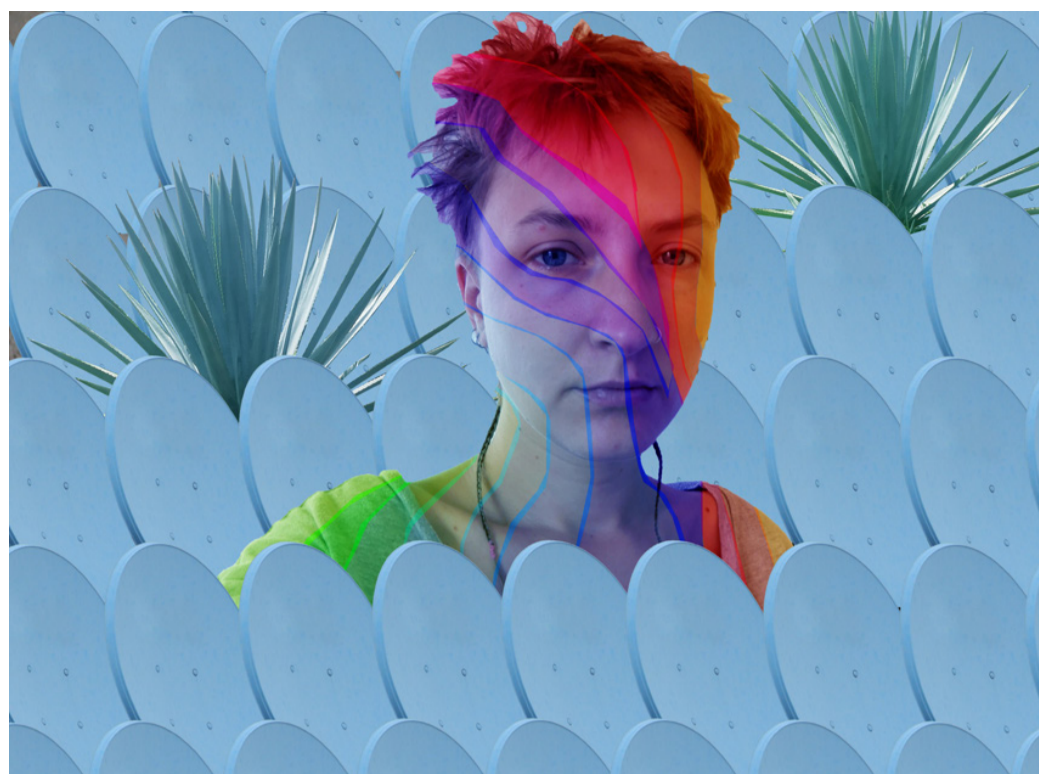
Parabólica | Agosto 2018

Así que me decidí por un taller de producción tatuaje y un curso de teoría/práctica de Arte e identidad queer. Estaba muy contento con ambos cursos. Siempre me ha parecido interesante el tatuaje y estaba muy contenta de tener ahora una idea. También fue interesante para mí conocer una conexión entre los tatuajes y el arte, porque en Alemania se siente que estos son muy separados uno del otro. El curso Arte e identidad queer me atrajo de inmediato, porque llevo tiempo tratando temas queer y la idea de un curso teórico que establezca relaciones entre el arte y realidades queer, pero que también muestre contextos históricos y representaciones de artistas queer, ya me ha despertado mucho entusiasmo y anticipación desde el principio. Para el curso de tatuaje tuve que comprar muchos materiales al principio; pluma estilográfica, tinta, lápiz, cúter, bloc de dibujo, papel albanene, más tarde también máquina de tatuaje, tinta, agujas, todo el equipo.