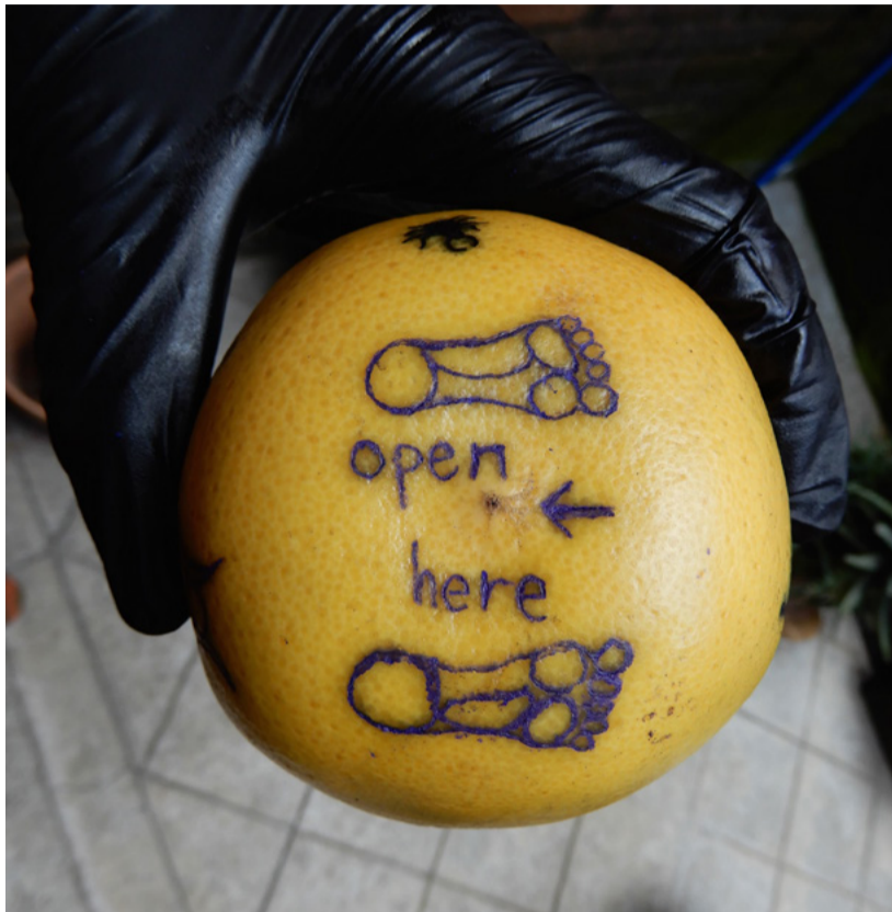
Tatuaje en naranja | Agosto 2018