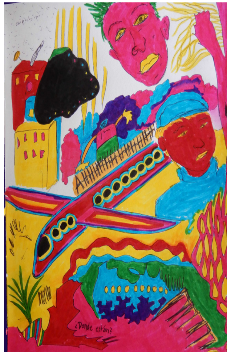
Arribando | Agosto 2018