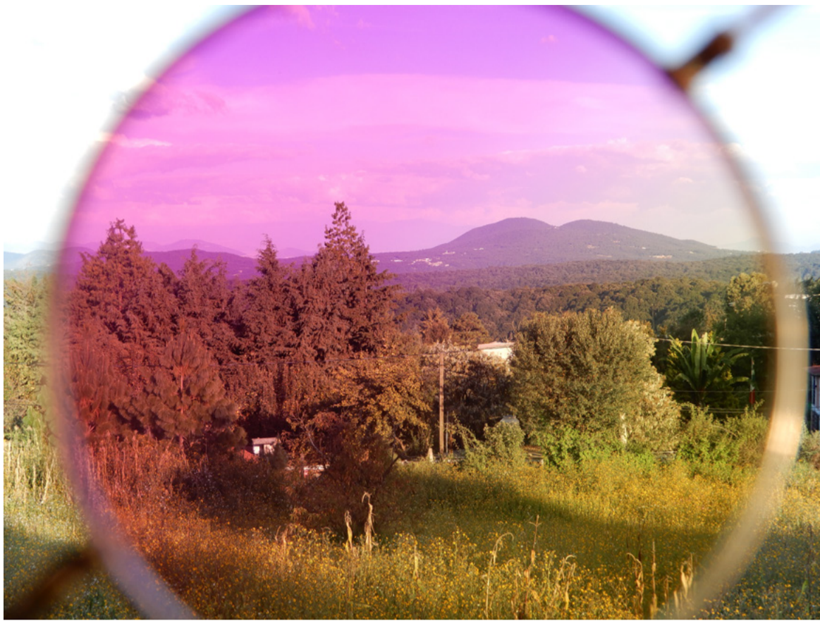
Tlazala de Fabela | Septiembre 2018

Todo el tiempo que pasé en la Ciudad de México fue muy instructivo y emocionante para mí. He aprendido mucho sobre mí misma, el arte, el mundo del arte, el racismo, la pobreza, la distribución desigual de la propiedad, pero también otros contextos del sistema capitalista global.