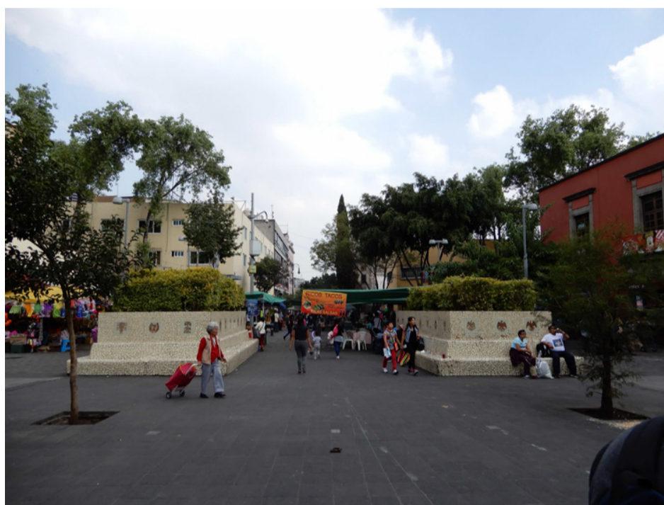
La Merced | Septiembre 2018

El curso consistió en 8 horas semestrales por semana. Cuatro el lunes, cuatro el jueves. El plan era dibujar cada lunes y tatuar cada jueves. Al principio estaba muy interesado, pero acompañado de dudas, porque el profesor y yo no estábamos realmente en la misma onda y a veces había dichos que eran un poco machistas para mí. Sin embargo, fui a los dos y medio primeros meses a las clases de tatuaje, tanto porque todavía quería aprender a tatuar, como porque no podía decidirme realmente en contra. En la clase de dibujo del lunes me dijeron una y otra vez que no podía dibujar en mi estilo, que las cosas que dibujaba era “falso”, no entendí esto al principio, hasta que descubrí que él quería que imitáramos estilos, símbolos y cosas de los libros de tatuajes. Cuando le pregunté si sería así durante todo el curso, me dijo que quizás más tarde podría probar mi propio estilo. Desde esta actitud me sentí un poco restringido, por un lado porque el sistema de la universidad de Braunschweig es más libre, donde no tenemos ninguna tarea, ninguna expectativa en este sentido, por otro lado porque también tenía otras ideas sobre los tatuajes que el profesor. En algún momento empecé a no ir al curso con tanta regularidad porque no me sentía muy cómodo, pero no podía tomar la decisión correcta.