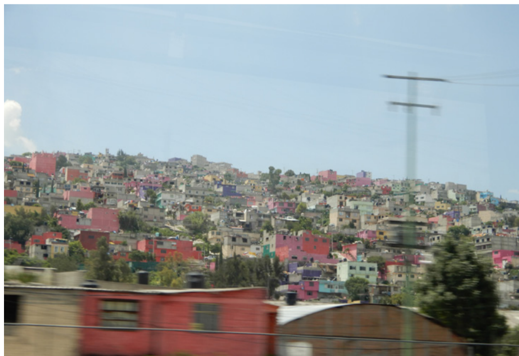
Ciudad colorida | Agosto 2018

El curso consistió en 8 horas semestrales por semana. Cuatro el lunes, cuatro el jueves. El plan era dibujar cada lunes y tatuar cada jueves. Al principio estaba muy interesado, pero acompañado de dudas, porque el profesor y yo no estábamos realmente en la misma onda y a veces había dichos que eran un poco machistas para mí. Sin embargo, fui a los dos y medio primeros meses a las clases de tatuaje, tanto porque todavía quería aprender a tatuar, como porque no podía decidirme realmente en contra. En la clase de dibujo del lunes me dijeron una y otra vez que no podía dibujar en mi estilo, que las cosas que dibujaba era “falso”, no entendí esto al principio, hasta que descubrí que él quería que imitáramos estilos, símbolos y cosas de los libros de tatuajes. Cuando le pregunté si sería así durante todo el curso, me dijo que quizás más tarde podría probar mi propio estilo. Desde esta actitud me sentí un poco restringido, por un lado porque el sistema de la universidad de Braunschweig es más libre, donde no tenemos ninguna tarea, ninguna expectativa en este sentido, por otro lado porque también tenía otras ideas sobre los tatuajes que el profesor. En algún momento empecé a no ir al curso con tanta regularidad porque no me sentía muy cómodo, pero no podía tomar la decisión correcta.