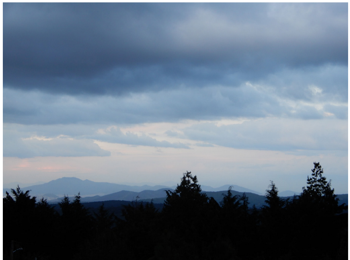
Las montañas | Septiembre 2018