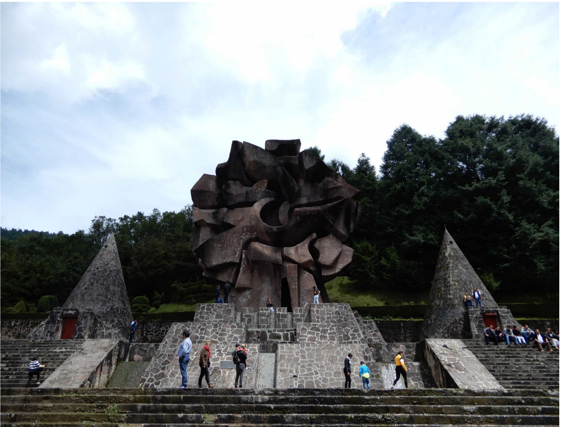
Plaza Otomí | Octubre 2018